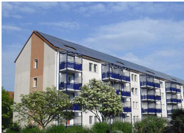
160,9 kWp Wohnungsbaugesellschaft Bitterfeld