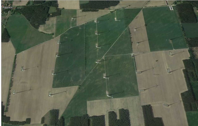
Windpark 23 Enercon-Anlagen E82 mit 52,9 MW