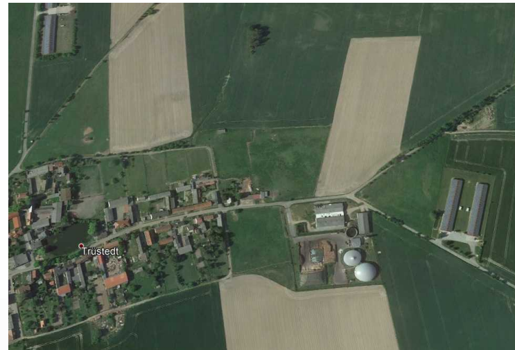
Biogasanlage Trüstedt 837 kW el