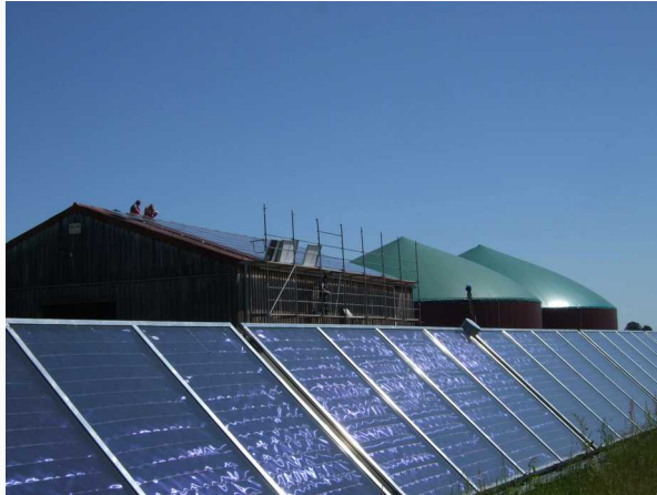
16,67 kWp Stadtwerke Wanzleben