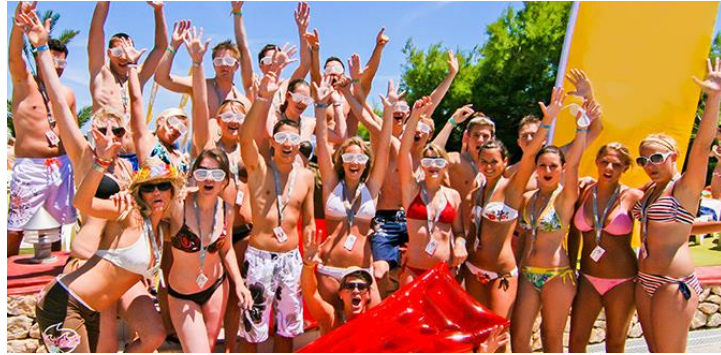
❖ Finanzierung von Abschlussfahrten