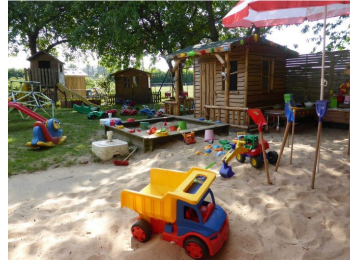
❖ Neues Spielzeug für die Kita