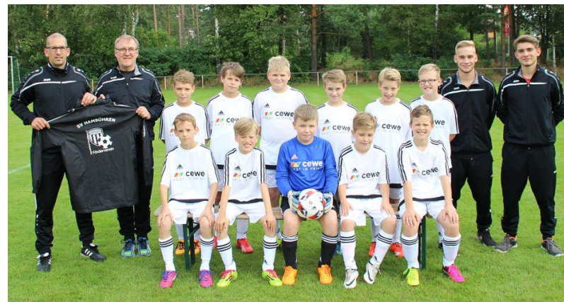
❖ Der neue Trikotsatz für den Sportverein